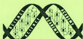
つくばサイエンス・アカデミー SCIENCE ACADEMY of TSUKUBA