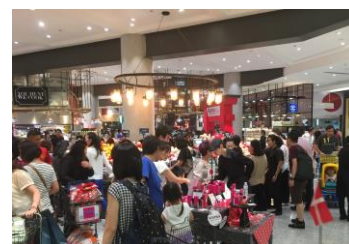
昨年度バンコクでの開催の様子